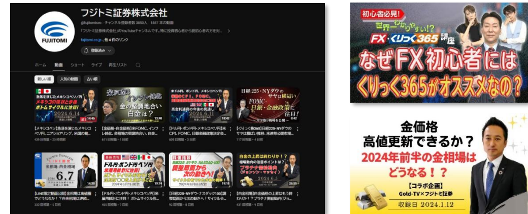
(フジトミ証券 公式YouTubeチャンネルより)

当社の公式YouTubeチャンネルでは、デリバティブ取引初心者向けにテクニカル分析の方法や取引戦略の立て方などを解説する動画を公開しています。