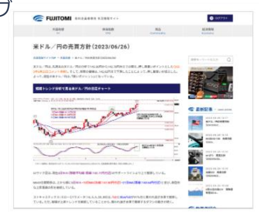
(フジトミ証券 有料会員サイトより)