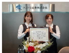
(株式会社サーティファイより表彰)

当社はビジネスコンプライアンス®検定試験への取り組みにおいて、2021年度最優秀団体賞を受賞しています。